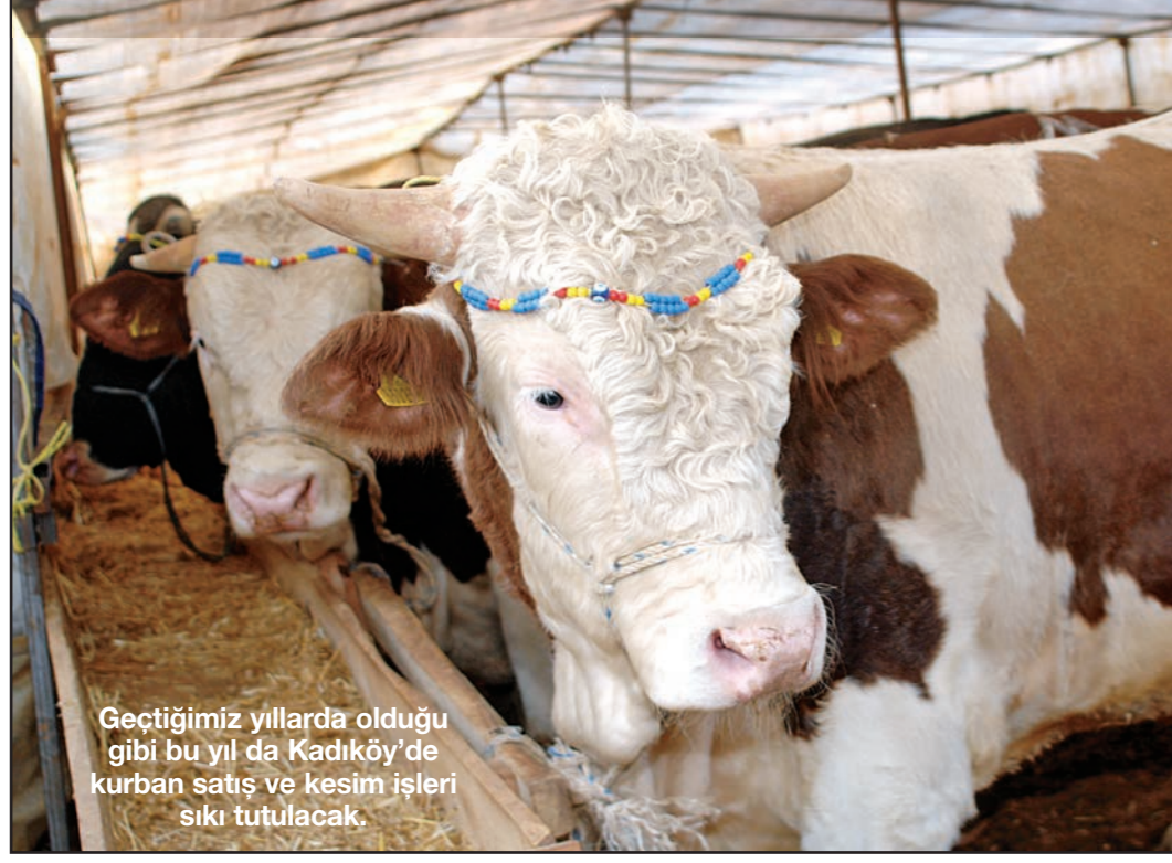
Geçtiğimiz yıllarda olduğu gibi bu yıl da Kadıköy'de kurban satış ve kesim işleri sıkı tutulacak.