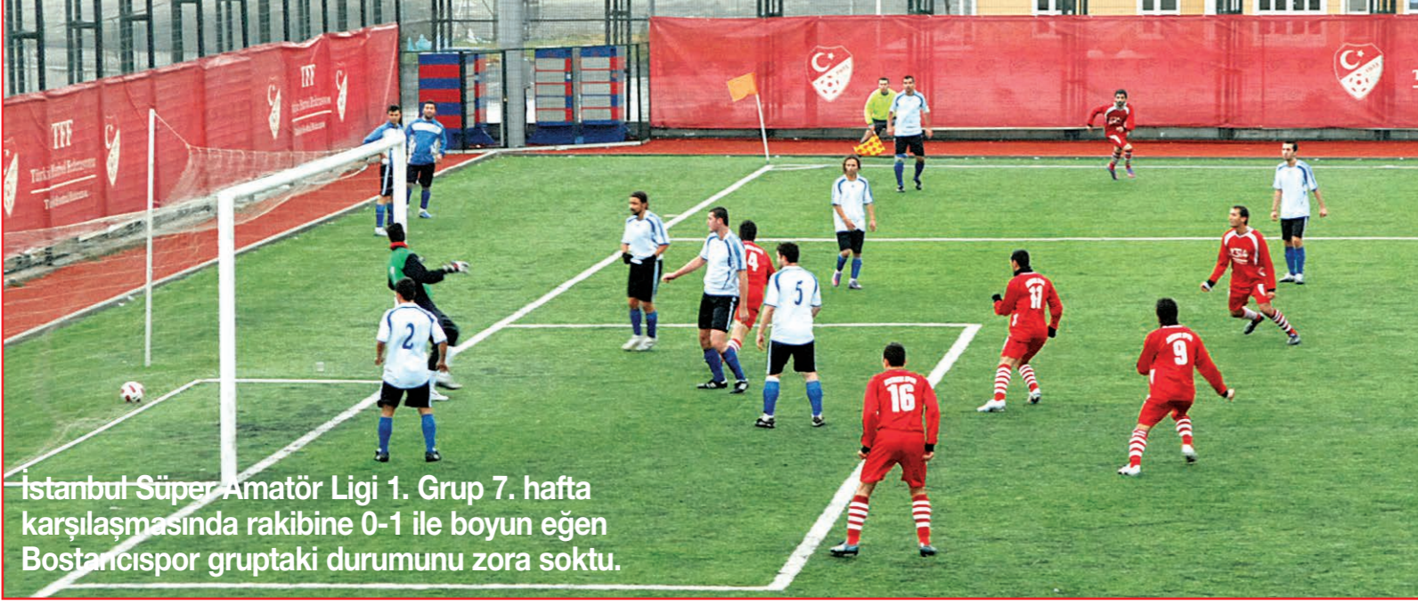
İstanbul Süper Amatör Ligi 1. Grup 7. hafta karşılaşmasında rakibine 0-1 ile boyun eğen Bostancıspor gruptaki durumunu zora soktu.

Ardı ardına aldığı yenilgilerle 13 takımlı grubunda 12. sıradan bir türlü kurtulamayan Bostancıspor en yakın rakibi Y. Kemal İ.Y.'den 6 puan geride bulunuyor. Bostancıspor'un toparlanabilmesi ve tehlikeli bölgeden kurtulabilmesi için transfere ihtiyacı olduğu gözleniyor.